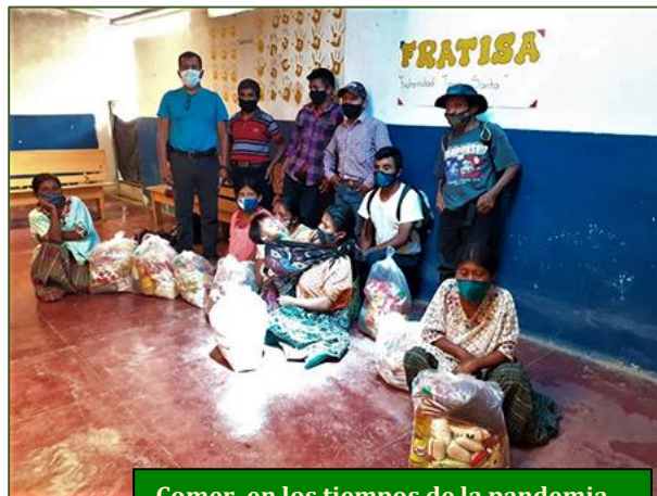
Comer, en los tiempos de la pandemia

Tampoco hemos querido descuidar el reparto de alimentos. Soy muy consciente de que los sacos de víveres ofrecidos no sirven para que con su contenido una familia numerosa se pueda alimentar. Mas, aun así, la ayuda es muy valiosa. Los aldeanos pobres acostumbran a comer simples tortillas de maíz, aderezadas con hierbas del campo. Y, por supuesto, quienes disponen de algunas gallinas, pueden regalarse de vez en cuando unos huevos a la piedra. Pero,