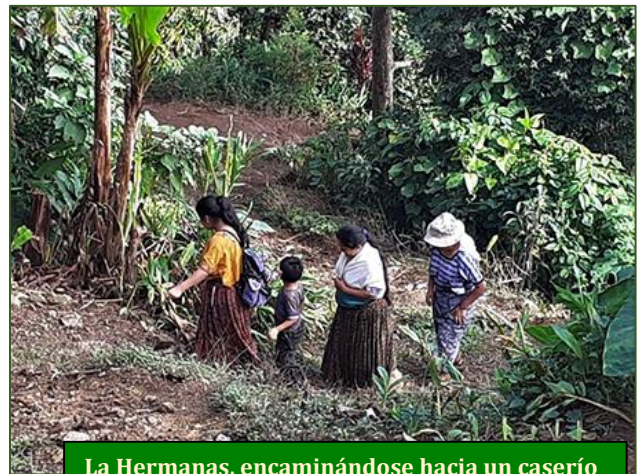
La Hermanas, encaminándose hacia un caserío

En ese mismo ámbito solidario, quiero incluir a quienes, en primera línea, van canalizando allí nuestros desvelos. Al no tener Fratisa presencia física en Tamahú, necesitamos forzosamente un equipo cooperante que haga realidad nuestros anhelos. Por fortuna lo tenemos.