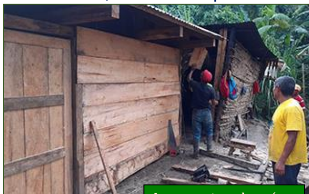
La casa, antes y después