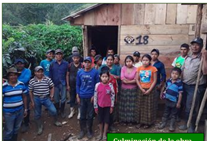
Culminación de la obra

Ya de regreso a Tamahú con mis pancojenses, capté que susurraban entre ellos pensando en la posibilidad de que yo me animara a llevarlos en mi carro hasta el caserío de Eben Ezer, que les queda bastante más cerca. Sin embargo, yo tenía otro plan. Mientras ellos parloteaban, me escurrí. Al cabo de unos minutos, regresé con comida rápida (varios pollos asados), con unos pasteles y con bastantes refrescos. Y no solo eso. También había comprado tres pares de botas de hule para quienes tenían casi inservible su calzado. Mi gesto les llegó. Tanto que, renunciando a que yo los llevara, me pidieron más comida y más pares de botas para algunos de sus niños que casi iban descalzos. Fue magnífico, pues –sin necesidad de hacer trato alguno– quedó convenido que su paga consistiría en alimentos, así como también en algunas botas de campo.