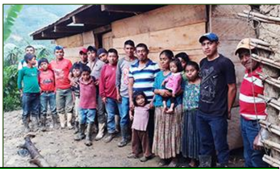
El nutrido equipo de trabajadores para la casa de Quej Ja

Lo que sí causó impacto fue el hecho de que Fratisa me invitara a repartir otras cincuenta bolsas «extra», para paliar con ellas los estragos de la pandemia. Como beneficiarios, elegí a muchos pobres que viven en los arrabales del núcleo urbano. Por no residir en las aldeas, se supone que cuentan con más medios de subsistencia. Tal es cuando menos la teoría. Sin embargo, en la práctica se ve que