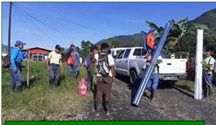
Llegada del material para la construcción de una vivienda

Contamos también con el apoyo logístico de Asumta, la ONG con la que no cesamos de estrechar vínculos. De hecho, desde hace dos años, la pastoral de enfermos en la parroquia de Tamahú viene gestionada por el tándem Asumta-Fratista. Tal consorcio resulta muy eficaz, ya que –con el respaldo económico de ambas instituciones– se alcanzan cotas de otra forma inasequibles. Entre todos (los de acá y los de allá), logramos descubrir a Dios en la desventura del pobre. Y ayudándolo, intentamos vivir el evangelio en los tiempos de la pandemia.