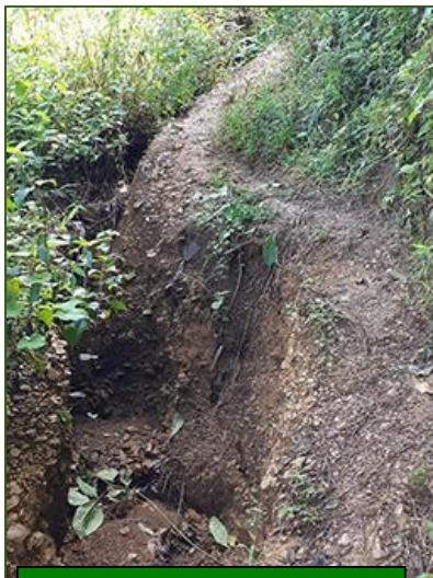
Caminante, no hay camino

de enfermos, alivia la hambruna de unas 2.500 familias. Y casi una veintena, hasta la fecha, han podido trocar el misero cuchitril en el que vivían por una casita tan falta de lujo como sobrada de decoro. ¡Milagros de la solidaridad!