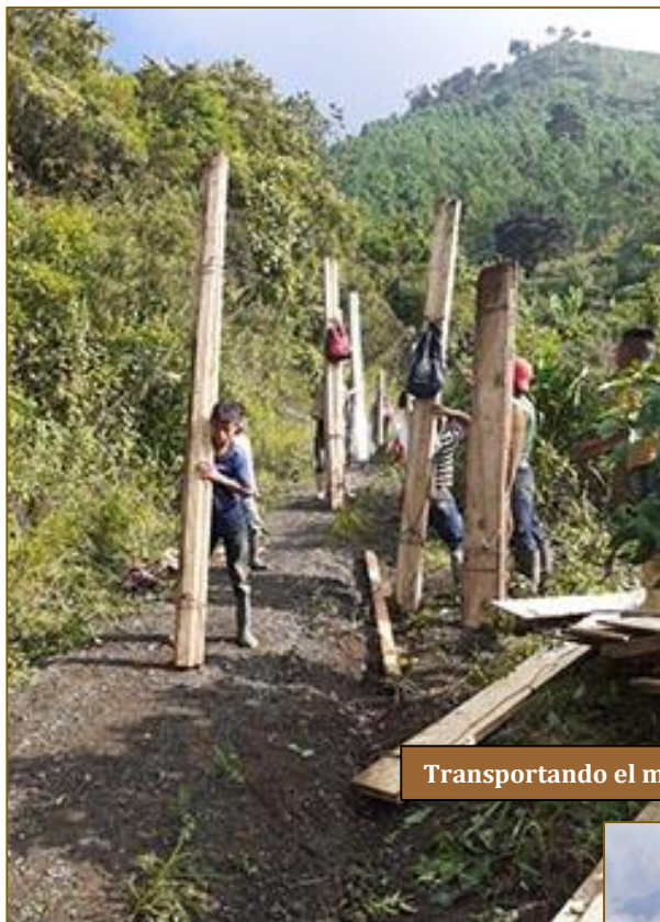
Transportando el material

Si bien se les había inscrito como candidatos a una nueva vivienda, solo se lo notifiqué a comienzos de octubre, tras repartir los alimentos en los locales de Asumta. Su alegría resulta fácil de imaginar. Aunque