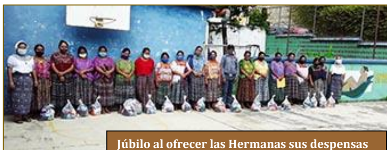
Júbilo al ofrecer las Hermanas sus despensas