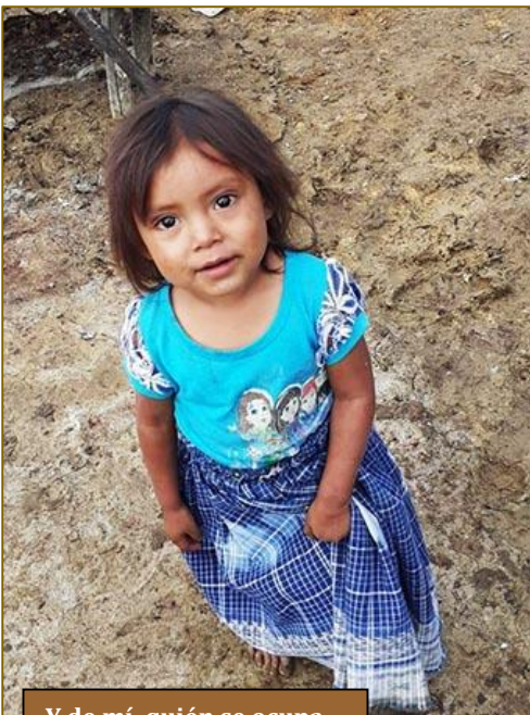
Y de mí, quién se ocupa

Nunca hubiera imaginado que la obra solidaria de Fratisa pudiera adentrarse hasta en los más recónditos rincones de unas aldeas y caseríos, donde el simple hecho de vivir hasta casi se antoja un lujo. No es que yo visite personalmente esas misiones, pero sí lo hago a través de nuestros colaboradores, con quienes acostumbro a mantener una fluida comunicación telefónica. Son ellos quienes me comparten las dificultades vinculadas con la pandemia, los celos de algunos aldeanos al verlos llegar, las pocas rosas y las muchas espinas con que se topan al intentar ofrecerles ayuda. Hace apenas unos días me refirieron un episodio que me reafirmó en lo que con frecuencia recalco: «Ayudar no siempre es fácil». Si alguien lo duda, que