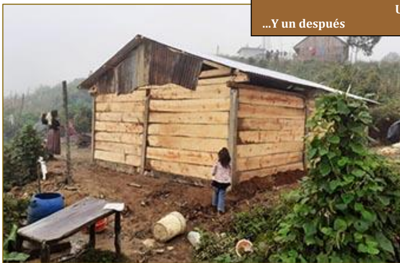
...Y un después