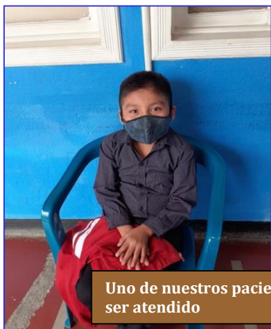
Uno de nuestros pacientes a la espera de ser atendido

Una vez más debo reseñar que nuestros discapacitados siguen el ritmo de sus terapias en Fundabiem. Más aún, tras las restricciones debidas a los confinamientos, parece que ya se está recobrando la normalidad y nuestros once pacientes reciben su debido tratamiento. Me sorprende comprobar que nadie suele faltar a la hora de trasladarnos a Cobán. Se ve que se ha establecido ya una rutina y todos se ajustan a ella. Antes era menos fácil mantener la disciplina. Entre los indígenas, se impone tener gran dosis de paciencia. Solo así se logra que un proyecto como el nuestro acabe echando raíces.