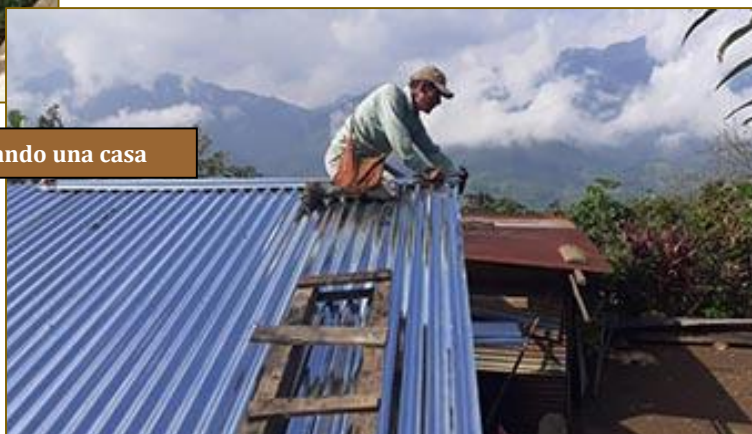
Techando una casa

Sé muy bien que en los caseríos serranos no suelen faltar rencillas. Pero tampoco ignoro que muchas personas hacen en ellos gala de un extraordinario espíritu solidario. Con él y unos días de trabajo a destajo, conseguimos levantar la casita. Dicen que la práctica hace al maestro. Sin presumir de profesional al respecto, puedo garantizar que cada vez le tomamos mejor el pulso a la construcción de unas viviendas en las que se podrá vivir con un mínimo de confort.