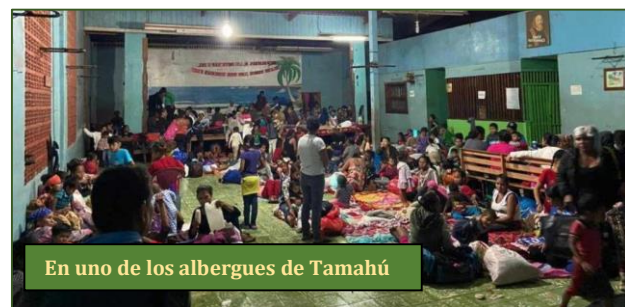
En uno de los albergues de Tamahú

poca paciencia, bien que mal, se estaba casi controlando la situación. Pues bien, fue entonces cuando –casi sin previo aviso–... ¡se presentó el huracán Eta!