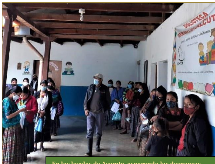
En los locales de Asumta, esperando las despensas