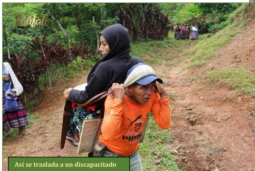
Así se traslada a un discapacitado