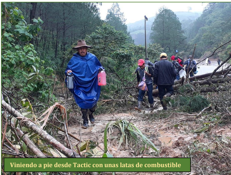
Viniendo a pie desde Tactic con unas latas de combustible

Al reanudarse el tránsito, recobramos de inmediato el ritmo de nuestras terapias, trasladando a nuestros pacientes hasta Fundabiem, siempre con las restricciones recomendadas: uso de mascarilla y frecuentes lavados con gel en alcohol para mantener desinfectadas las manos. También ponemos especial énfasis