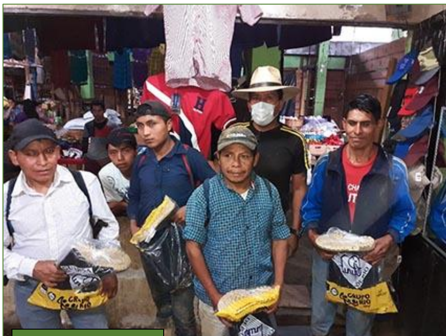
El equipo de trabajadores

Antes de darle la buena noticia de construirles una mejor vivienda, se determinó que su terreno no estaba acorde con las medidas de las casas ofrecidas por Fratisa (35 metros cuadrados), pues por el costado derecho, muy pegado a su chocita, había un precipicio que nos iba a dificultar la excavación. Se corría