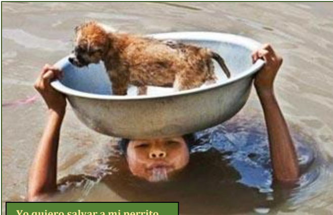
Yo quiero salvar a mi perrito

las unidades de socorro tardaron bastante en llegar, ya que en toda aquella región no hay ni carreteras ni apenas caminos. Por otra parte, la inclemencia climática dificultó las maniobras de los helicópteros.