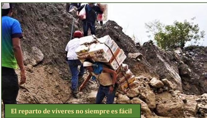
El reparto de víveres no siempre es fácil

siendo un enorme cementerio. Únicamente resta pedir a Dios que no ocurra igual con Quejá. Aunque mucho me temo que solo seguirán Prodigándose promesas. Y es que, como bien dice una amiga indígena, «prometer no empobrece».