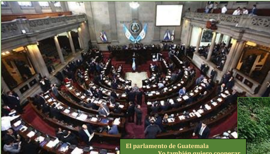
El parlamento de Guatemala Yo también quiero cooperar

nueva sede para el parlamento, sabiendo que la actual era buena hasta que el incendio de hace unos días (¿quién lo provocó?) la destruyó casi por entero. Estas y otras arbitrariedades, donde se favorecía a una élite privilegiada a costa de una mayoría mar-