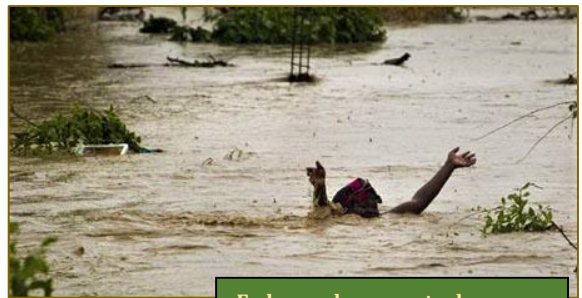
En busca de un punto de apoyo

Lo normal es que no se mueran de hambre, pues mientras no les falte el maíz sobreviven. Pero no sin verse minados por un sinfín de enfermedades, cuya causa primera acostumbra a ser la desnutrición. Tal es el motivo por el que Fratista, desde que el coronavirus ha impuesto su ley, no ha cesado de repartirles alimentos. Son ya varios miles las despensas con las que –mes tras mes– tratamos de paliar los estragos de su hambruna. Nos parecía que, con mucho esfuerzo y no