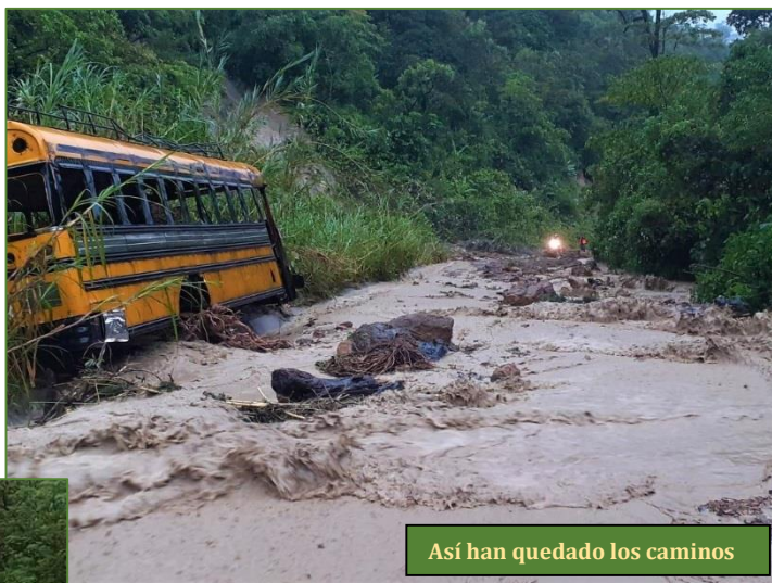
Así han quedado los caminos

Desde lejos no resulta fácil evaluar el caos