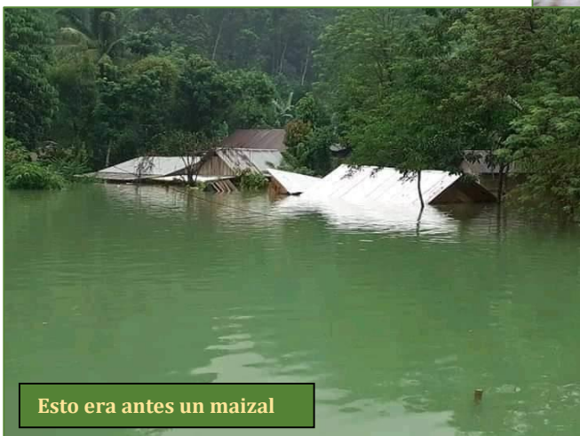
Esto era antes un maizal

que generan tales catástrofes. Y más en este mes que han venido dos casi seguidas. Tras el ímpetu destructor del Eta, nos llegaron los aguaceros del lota. ¡Si no quieres caldo, dos tazas! ¿Sobreviviremos? Con la ayuda de Dios, así será. Quienes estamos en el campo, acabamos haciéndonos expertos en infortunios. Por eso, a pesar del caos, hemos continuado con nuestras labores, aun cuando las circunstancias nos hayan forzado a interrumpirlas en más de una ocasión. Ante coyuntura tan delicada, la gota que ha colmado el vaso