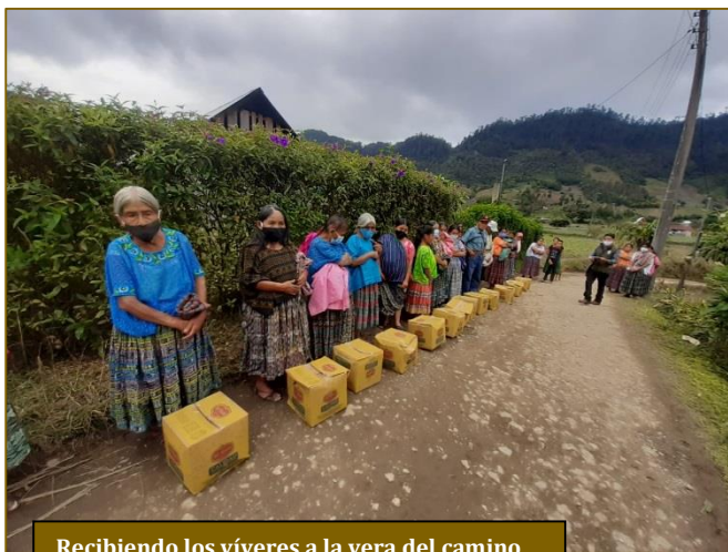
Recibiendo los víveres a la vera del camino

que los caminos eran lodazales y ellas no disponían de botas. Pero todo se logró. Su reparto fue así: Panteón (50 bolsas), Panzub (88 bolsas) y área metropolitana (62 bolsas). Y ello sin olvidar que algunas familias llamaban a la puerta de sus conventos y ninguna se marchaba sin recibir ayuda. Ha sido una preparación muy linda para la Navidad. Las seis Hermanas se han sentido muy felices porque han cubierto todos sus objetivos. Y muy agradecidas a Fratisa por su generoso respaldo económico. Sorprende que todo se haya podido hacer, a pesar de los contratiempos. Los hubo.