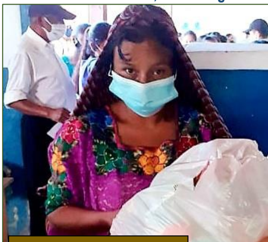
Recibiendo su regalo navideño

Las dos primeras semanas de diciembre el pueblo de Tamahú estuvo confinado a causa de un brote del coronavirus. Por fortuna, los contagios fueron controlados y el pueblo recobró su normalidad a mediados