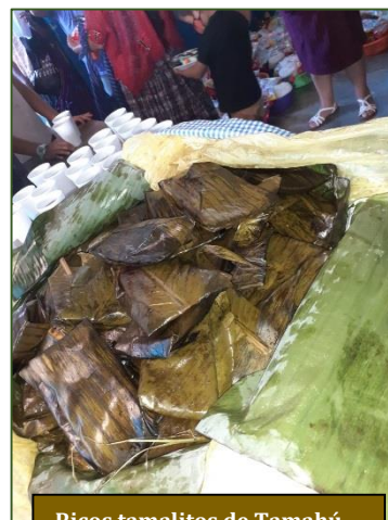
Ricos tamalitos de Tamahú