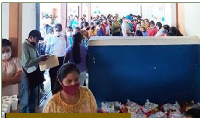
Celebrando con antelación la Navidad

Cada país tiene sus antojos culinarios. Y estos suelen dejarse sentir con motivo de la Navidad. Según he sabido, entre ustedes imponen su ley los turrones. Nosotros, en cambio, acostumbramos a rendir tributo a «su majestad» el tamal. Es un alimento hecho con masa de maíz, dentro de la cual se coloca una pieza de pollo o carne, sin que falte la sazón de algunos chiles o frutitas trituradas. Para nosotros es un manjar exquisito. Pues bien, quise que todos los agradecidos con una bolsa de comida pudieran saborear también las delicias de un succulento tamal. Aunque sin ningún protocolo e incluso sin sillas donde sentarse, resultó un momento cálido, pues todos