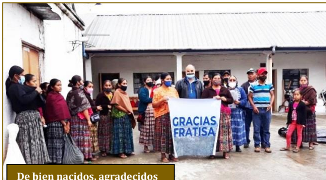
De bien nacidos, agradecidos

Han sido para ellas jornadas de mucho trajín. Recibieron la visita de su Consejo General, tuvieron durante cuatro días un taller vocacional e impartieron charlas prebautismales. Pero aun con eso pudieron establecer contacto con las familias, llevando las bolsas de comida a quienes más la precisaban. Para