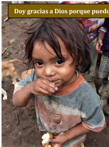
Doy gracias a Dios porque puedo comer

S iempre se ha sabido que, tras toda borrasca, suele seguir la bonanza. Y es desde ella cómo mejor se aprecian los estragos de la procela. Algo así ha ocurrido en la zona donde Fratisa mantiene su obra solidaria. En ella sigue aún muy vivo el recuerdo de los huracanes Eta y Iota que pasaron sembrando caos. Fueron muchas las personas que quedaron sepultadas bajo algún alud o que vieron cómo sus viviendas eran arrastradas por la riada. Sin embargo, ese tiempo de pánico y angustia fue relativamente corto. Tras varios días de zozobra, se recobró el