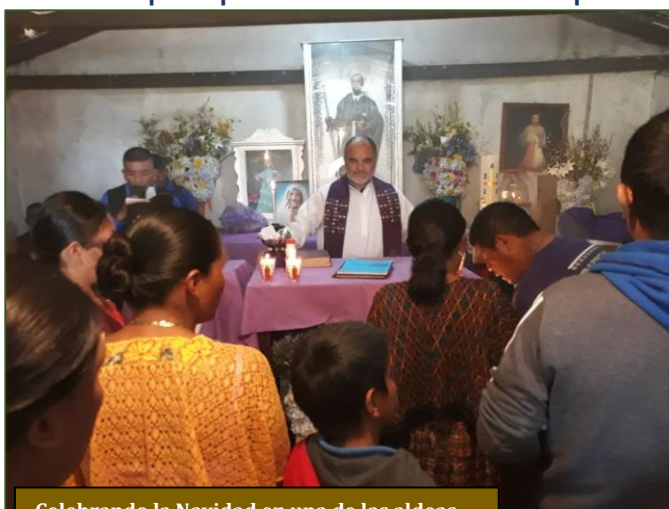
Celebrando la Navidad en una de las aldeas