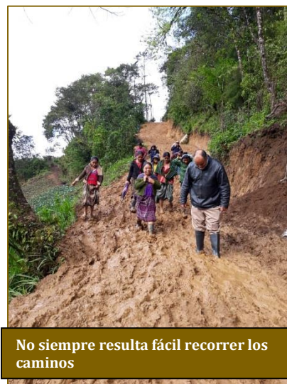
No siempre resulta fácil recorrer los caminos

Es esta una labor más ardua de lo que pudiera pensarse. Exige, en efecto, una visita previa a la comunidad que se desea ayudar. Y si normalmente no resulta fácil hacerla, ahora puede antojarse titánica. De hecho, muchos caminos están cubiertos con una densa capa de lodo. Para transitarlos, se precisan botas de hule. Y para transportar los alimentos no siempre resulta útil un todoterreno. A veces se requiere tracción humana. Por fortuna nunca ha faltado el apoyo de jóvenes comprometidos que ofrecen su tiempo y su vigor para lenificar penurias