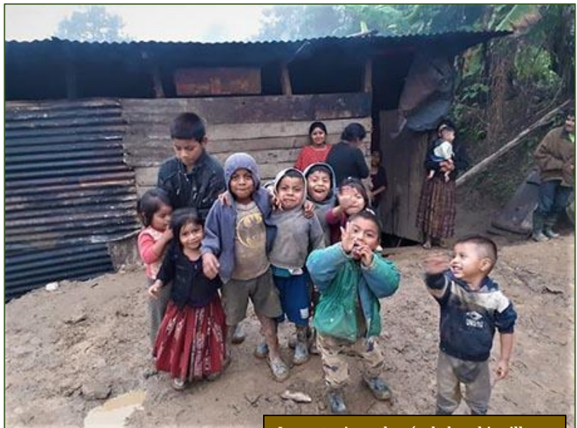
La contagiosa alegría de los chiquillos