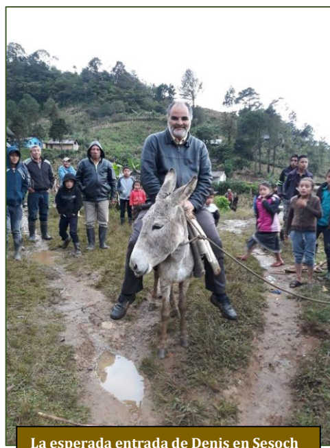
La esperada entrada de Denis en Sesoch

En todo caso, los borricos gozan de buena salud. Y eso por fuerza ha de celebrarse como excelente noticia.