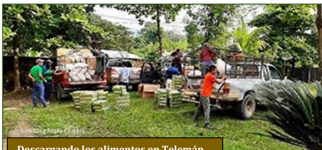
Descargando los alimentos en Telemán