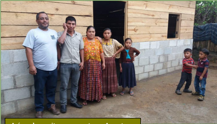
Así son las casitas que construye Asumta