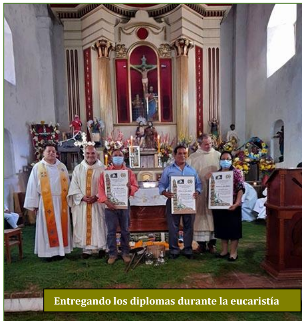
Entregando los diplomas durante la eucaristía

Así se expresa la fe en las fiestas patronales de Tamahú.