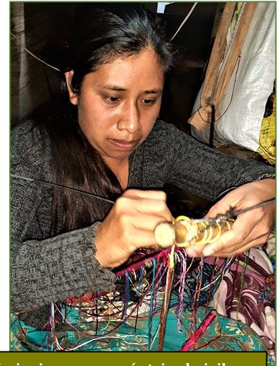
Varias jóvenes mamás tejen huipiles

que llevaban ya varios días sin probar bocado. Al entregarle la bolsa, se agarró