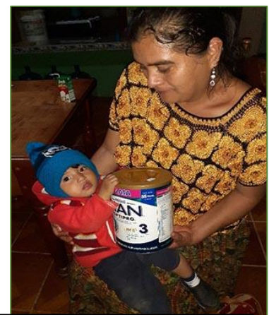
Ofreciendo leche pediátrica para un recién nacido

De hecho, la ayuda a nuestros discapacitados es el proyecto estrella dentro de la pastoral de enfermos que, desde hace un par de años, vienen gestionando Asumta y Fratisa. Ya son cerca de quin-