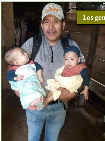
Los gemelos, ya restablecidos

A todos nos resulta conocido el refrán: «El hombre propone y Dios dispone». Mas, aun sabiéndolo, no siempre resulta fácil aceptar sus implicaciones, sobre todo cuando nos afectan de manera directa. Algo así ha ocurrido con las terapias que vienen aplicándose a nuestros discapacitados en Fundabiem de Cobán. Ya llevábamos algunos meses con un tira y afloja, pues a