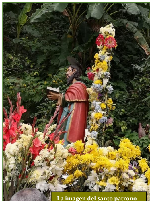
La imagen del santo patrono