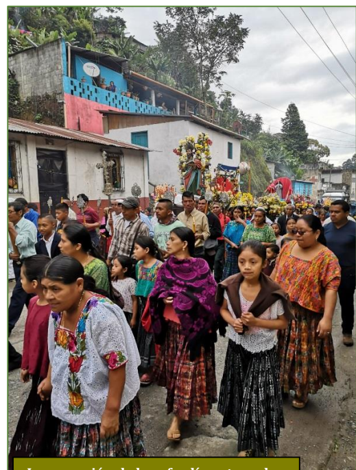
La procesión de la cofradía patronal

Su origen se remonta al medioevo, donde se erigieron en catalizadoras de una catequesis cercana al pueblo, aunque