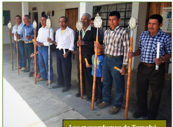
Los mayordomos de Tamahú

las restricciones, se están planificando ya los proyectos pastorales de 2021. Para ello, el párroco cuenta con un selecto grupo de voluntarios, así como también con el equipo de Hermanas Misioneras de la Eucaristía, con quienes – desde hace casi un decenio – nos unen vínculos bastante estrechos. Ellas han sido quienes, en nombre de Fratisa, han repartido últimamente varias toneladas de víveres para amortiguar los estragos de la hambruna.