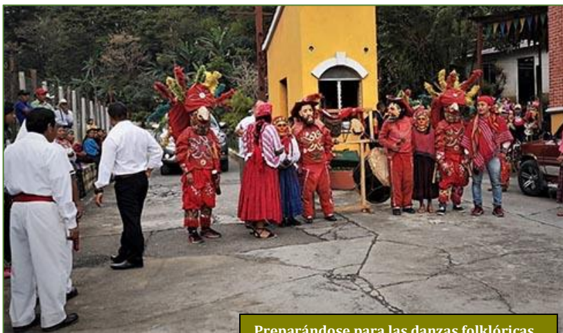
Preparándose para las danzas folklóricas

Han pasado casi cinco siglos y cada comunidad indígena de Guatemala sigue contando con un determinado número de cofradías. En todas ellas se ocultan resabios inequívocos de religiosidad prehispánica. Tal es, entre otros, el caso de Tamahú. En él se mantienen activas ocho cofradías en su núcleo urbano y otras quince en sus aldeas. Desde un primer momento, sorprende el concejo de los ancianos (14) y de los mayordomos (8). Aun sin captar su razón de ser, se los intuye portavoces de un impoluto costumbrismo, donde la religión canaliza la propia cultura. Y es que para el mundo maya toda la naturaleza está animada. En cada cerro mora un espíritu.