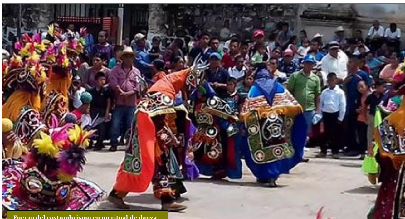
Fuerza del costumbrismo en un ritual de danza

Aun celebrándose el 25 de enero, los festejos se inician unos cuatro días antes. Resulta emotivo ver cómo cada aldea, en una solemne procesión, va bajando al santo que da vida a su cofradía, para encontrarse con la colectividad frente a la iglesia parroquial. Y en ella adentran a todas sus imágenes que –juntamente con la de san Pablo– han de orquestrar las celebraciones. Estas acostumbran a gravitar