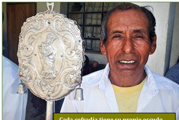
Cada cofradía tiene su propio escudo

Los pueblos indígenas de América hacían gala de una rica cultura y unas prácticas religiosas dignas de