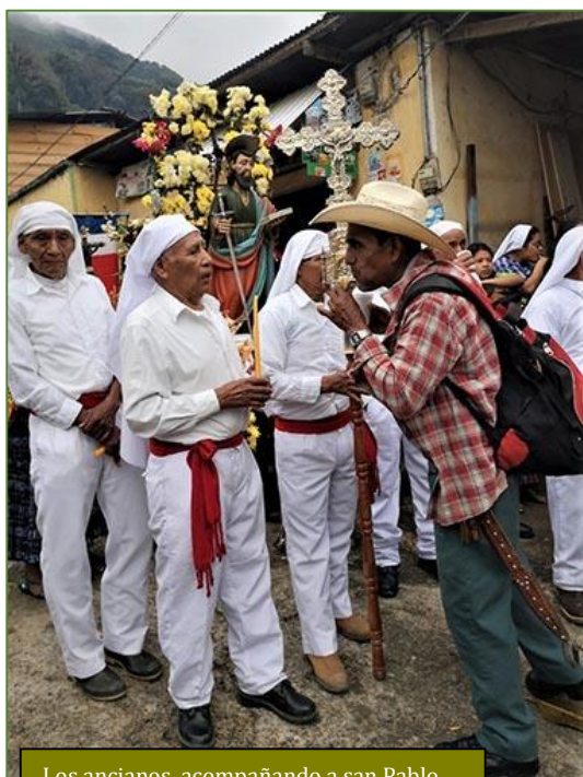
Los ancianos, acompañando a san Pablo

todo respeto. Ocurrió, sin embargo, que –al ser doblegados por los conquistadores– entendieron su sino como la resultante de una lucha de dioses, en la que los suyos habían sido subyugados por los ajenos. Poco debió sorprenderles, pues, que sus nuevos amos les impusieran sus propias reglas de juego. Estas les exigían renunciar a sus creencias para asumir las dictadas por quienes se creían superiores. Vieron