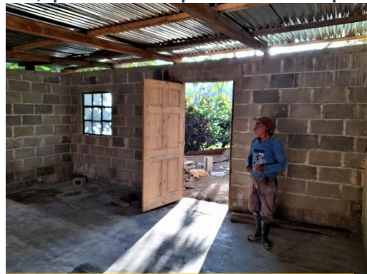
La última casita, por dentro