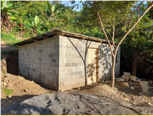
La última casita, por fuera

viaja desde la capital en un pullman de lujo que resulta bastante cómodo. He tomado nota y creo que la próxima vez haremos nuestra su experiencia.