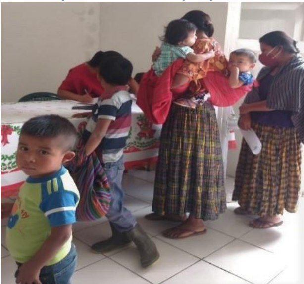
A la espera de consignar la firma

toparse con tamaña multitud. Me expresaron su sorpresa por el hecho de que no los hubiera invitado con anterioridad. Me garantizaron que con mucho gusto cooperarían en el futuro, pues es esta una obra humanitaria por la que vale la pena apostar.