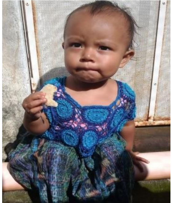
Marisela tiene muy buen apetito

En el mes de agosto, el reparto se fijó para el día 8. Fueron varias las personas que me expresaron su alegría, dado que el mes anterior (debido a la visita de los miembros de Fratisa) se les había convocado para el día 17. Ese había sido un momento muy especial, por lo que se cursó una invitación a la mesa directiva de Asumta, representada en el evento por varios socios, que quedaron asombrados al