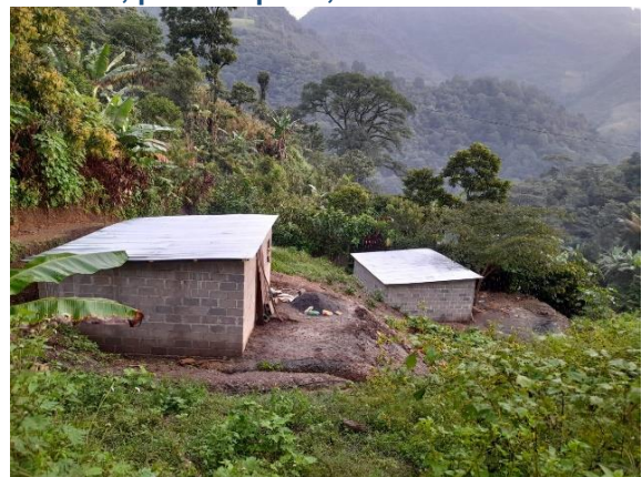
Las dos últimas viviendas, hechas ya con ladrillo