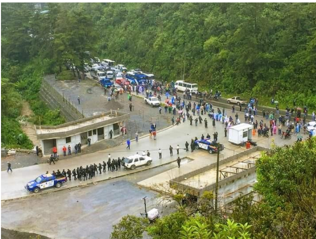
Los incómodos bloqueos de carreteras

Tanto ella como su esposo han recurrido a curanderos y hechiceros, con los que se han gastado su muy escaso patrimonio. Al endeudarse, pensaron incluso en malvender su casita. Por fortuna no lo hicieron. Pero, entre sanadores, nigromantes y otras gaitas, los dejaron en la pura miseria. Me confesó que, como último recurso, había acudido finalmente a un médico, el cual le recetó unas ampollas. Mas solo pudieron comprar dos. Aunque sus efectos fueron positivos, se encerró de nuevo en sí misma, huyendo de cuanto pudiera alterarla.