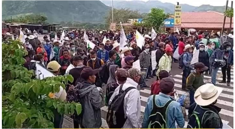
Las manifestaciones suelen ser masivas