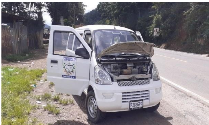
Nuestra furgoneta ha aprendido a averiarse

Estado ya allí con mis enfermos, me preguntaba: ¿qué ocurrirá al regresar? Temía toparme de nuevo con problemas. Para esquivarlos, busqué otra vía alternativa por el municipio de Chamelco. Esto tuvo sus dificultades, ya que –en cierto punto- había un hundimiento que impedía el paso del vehículo. Hice descender a toda mi clientela y con mucho cuidado conseguí sortear el enorme socavón. Mas no acabaron aquí las cuitas. Al rato, se nos detuvo porque estaban reparando el camino y la maquinaria realizaba un desescombro. De nuevo tuve que descender para negociar nuestro paso con los ingenieros. Estos fueron muy amables. Vía radio, ordenaron despejarnos el camino. Pude por fin pasar, llegando a la aldea de Sesarb, cuya ruta, además de bastante angosta, tiene fama de ser muy pendiente. Y lo era. Tanto que me vi precisado a comprimir el motor para no quedarme sin frenos. Fueron momentos tensos, pero llegamos sin novedad. Después supe que el bloqueo se había mantenido hasta muy entrada la tarde. Parece que san Cristóbal nos quiso proteger.