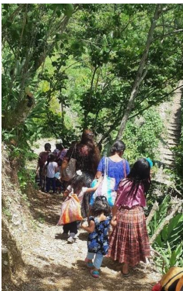
El regreso fue como una romería

Al llegar a una de las casitas, vi con agrado que los únicos muebles instalados en ella eran un banco y una mesa, donde nos agasajaron con un exquisito atole que disfruté y agradecí. Era la forma que tenían los agraciados con una vivienda de expresarnos su gratitud. Me solazó la visita de ese inesperado shangri-lá cuyo exotismo casi me robó el alma. Mientras recorríamos la propiedad, tuve ocasión de cruzarme con la cuadrilla de trabajadores que llevaba ya más de dos meses tratando de allanar las parcelas donde iban a levantarse las viviendas. Y es que todo el terreno está en un más que pronunciado desnivel. Su allanado me parecía gesta casi heroica. Más aún, al constatar que sus únicas herramientas eran unos azadones, unas palas y una carretilla para retirar el desescombro.