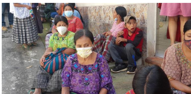
Las calles casi se congestionaron de gente

Raúl, fiel a su lema de decir poco y hacer mucho, lo tenía todo dispuesto sin que nosotros supiéramos a ciencia cierta lo se iba a hacer. Me resultó impactante ver en plena calle (los locales de Asumta