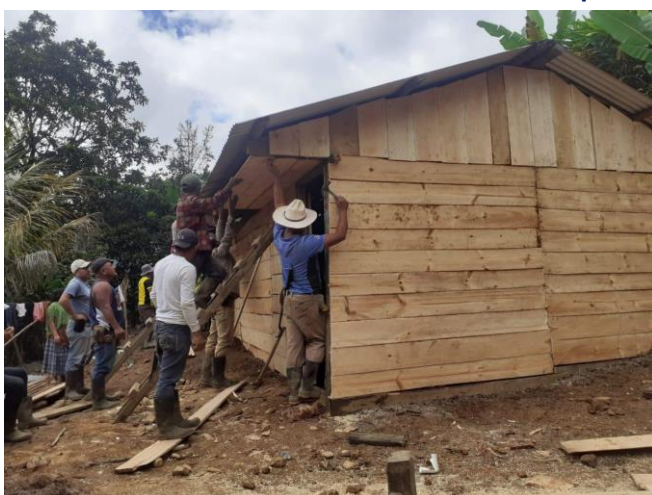
La vivienda, a punto de ser rematada

Este hecho, en apariencia trivial, creo que nos puede servir de lección. No es fácil, en realidad, encontrar entre nosotros un espíritu solidario con fuerza para convertir en propios los sinsabores ajenos. Sobre todo las grandes urbes nos aíslan. Aquellos indígenas de las perdidas aldehuelas serranas nos enseñan con su ejemplo que gestos como el suyo ayudan a cardar conciencias.