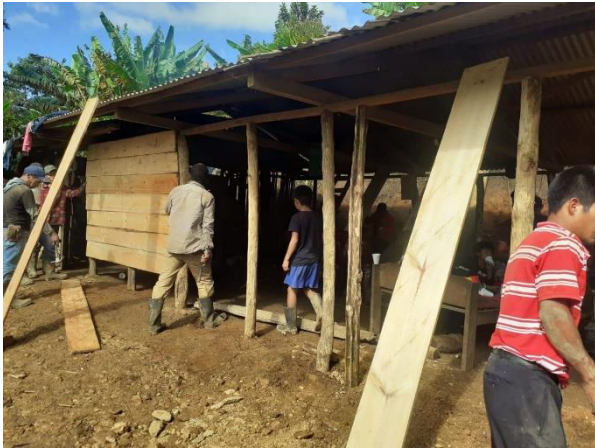
Trabajando en la construcción de la casa