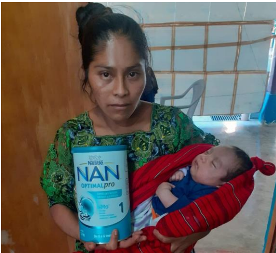
La leche pediátrica, el antídoto contra la desnutrición

al alarmismo. ¿Qué procedía hacer? ¿Decírselo? Quizá fuera preferible mantenerme callado, dejando que la naturaleza siguiera su curso. En realidad, estaba hecho un mar de dudas. Me da mucha pena la muchacha, pues mantiene intactas sus ansias de vivir. Posiblemente tendré que buscar el momento oportuno para que tanto ella como su familia se vayan familiarizando con la cruda realidad.