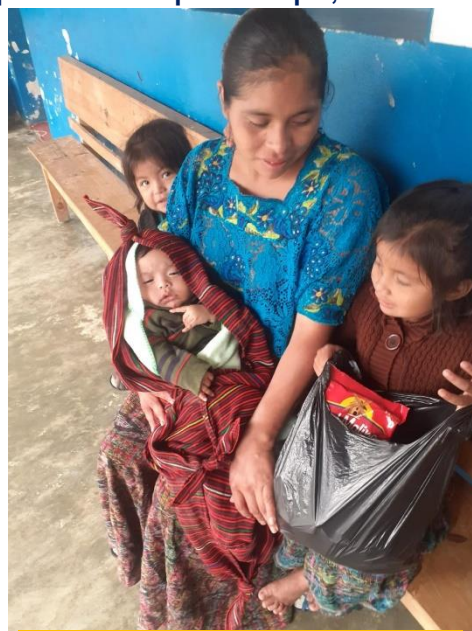
A la espera de la consulta pediátrica

Me angustia tropezarme con individuos que, además de mentirme, se resisten a recibir apoyo solo porque les impongo ciertas normas y ellos desearían hacerlo todo a su manera. Aunque no ocurra a diario, son frecuentes los rechazos debidos solo a la tozudez. ¿Acaso la anarquía -me lo cuestiono con frecuencia- se arropa en el evangelio?