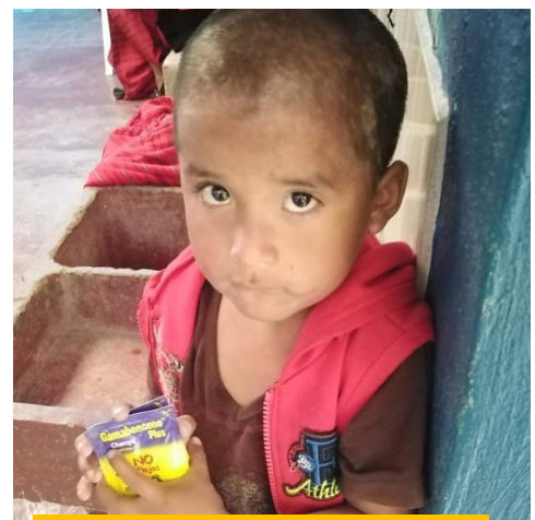
Yo prefiero mi refresquito

Aprovecharemos la coyuntura para repartirles los números antes de que se inicie la ceremonia. Al finalizar, se les distribuirán las despensas. Y, si alguien falta, no hay problema. Nos sobran indigentes a quienes ayudar. Sin embargo, estoy convencido que, cuanto llegue el momento, todos acudirán a la cita. Y más aún sabiendo que el evento culminará con el reparto de unos tamales y refrescos para así -aunque con cierta antelación- homenajear desde el fondo de nuestras almas al niño nacido en Belén.