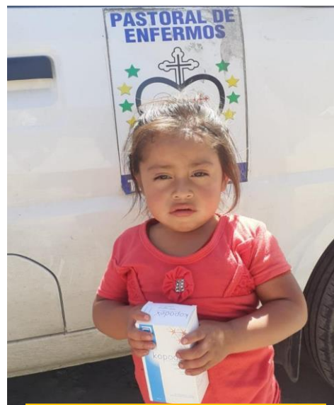
Fratista también cuida de mí.

Regresé muy triste con tal diagnóstico. Su padre compartía mi desencanto. Ambos aceptamos la cruda realidad y nos comprometimos a hacer todo lo posible para que pueda cuanto antes caminar de nuevo. Mas, por ahora, solo cabe asirse a la esperanza.