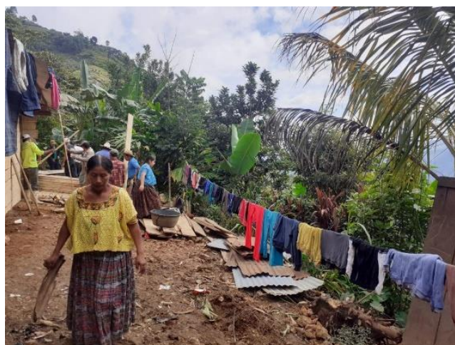
La generosa ayuda de las vecinas

Esa era, a grandes rasgos, la familia a la que Fratisa, a través de su representante Raúl, se comprometió a levantarle una vivienda. En realidad, solo se iba a revestir con nuevas maderas su vieja casucha, cuya estructura estaba a punto de derrumbarse por falta de mantenimiento. Mas tal labor debía ser previamente coordinada por quienes se comprometieran a ofrecer gratuitamente su trabajo y su