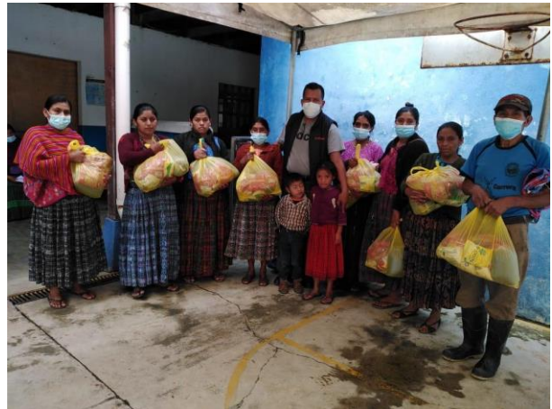
Todos reciben su despensa de víveres