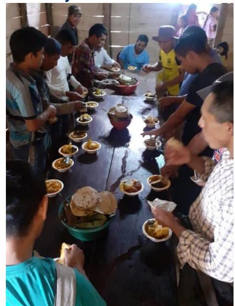
El reconfortante almuerzo de la cuadrilla