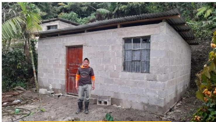
La novena casa del proyecto "Chiquín"

quería apadrinar, sufragando todos los gastos. El P. Denis, desde un principio, nos manifestó que su ya larga experiencia le aconsejaba desconfiar de tales promesas. De hecho, ocurrió que, al llegar el momento de involucrarse, los supuestos patrocinadores se echaron atrás. Fue entonces cuando, tras un breve coloquio, se vio la posibilidad de que el proyecto fuera asumido por Fratisa. Tras presentarlo a sus responsables, todos coincidieron en que valía la pena involucrarse en una obra llamada a ofrecer cierto bienestar a un número considerable de familias que no tenían ni dónde mantenerse vivas ni dónde caerse muertas.