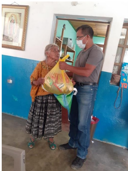
No quiere marcharse sin expresar su gratitud

Pulsando las fibras de sus sentimientos, los he invitado a un encuentro que tendrá lugar el próximo 11 de diciembre en la parroquia de Tamahú. Se ha convenido que, en la eucaristía que se celebrará a las tres de la tarde, nadie debe faltar. Aun respetando las creencias individuales o familiares, se les he pedido con ahínco que todos se personen en la parroquia católica para convertir la eucaristía en una viva expresión de gratitud por cuanto nuestros beneficiados han ido recibiendo a lo largo del año. Quiero que, en esa misa de acción de gracias, tengan muy presentes a los asociados de Fratisa, cuyos desvelos y sacrificios tanto les ayudan a desdramatizar su existencia. Aunque sean protes-