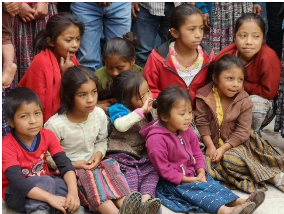
El candor de la infancia siempre solaza el alma

Los proyectos de Fratisa mantienen su pulso. Aunque resulte reiterativo, cabe consignar una vez más que el número de nuestros pacientes no cesa de ir en aumento. Y esto ha de verse como un arma de doble filo. Por una parte, nos complace comprobar que nuestras ayudas benefician a un colectivo cada vez más amplio de personas desvalidas. Mas, por otra, nos preocupa que nuestros gastos mensuales sean superiores a nuestros ingresos. Sabemos que una economía así está condenada a la bancarrota. ¿Qué hacer? Elevar una súplica a Dios, pidiéndole que no se olvide de nuestra misión guatemalteca. Y, tras encomendarnos a su providencia, redoblar nuestros esfuerzos, sabedores de que a veces el cálido flujo de la fe acaba diluyendo el frío cálculo de la razón. Por otra parte, alguien dijo en algún momento que, ayudando aunque solo sea a una persona, se ayuda a toda la humanidad. Nos aferramos a lo que tan bien plasmara el poeta: “Se hace camino al andar”.