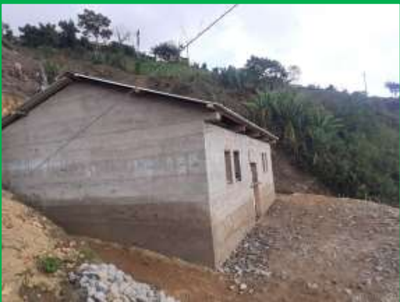
Así viven y así vivirán nuestros beneficiarios