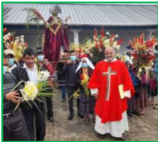
A punto de iniciar la procesión de Ramos