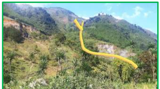
Muy arriba (en los picos de la V) se construirán las viviendas