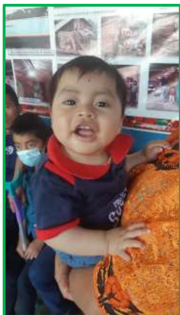
Yo quiero mi casita.... ¡ya!

No resultó difícil confeccionar el listado de los futuros beneficiarios. El problema estribaba en transportar hasta la aldea los materiales de construcción. Se procedió a una reunión comunitaria, donde todos se comprometieron a aportar sus esfuerzos, no sin antes asumir la inviabilidad de edificar su nuevo hogar con ladrillos (block). Y es que los todoterrenos solo pueden acceder hasta cierto enclave. A partir de ahí, todo ha de ser acarreado con pura tracción humana. Puesto que Pansup está casi en la cima del monte, subir tanta carga resulta extenuante. La sensatez exigía, por tanto, pensar en otro tipo de construcción. Y así se hizo.