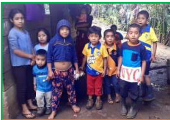
Los chiquillos de Yuxilhá, ya vestidos de limpio

En un santiamén todos los críos quedaron vestidos de limpio. Los papás me miraban alborozados, preguntándome con la mirada cómo podrían pagarme tanta generosidad. Los tranquilicé diciéndoles que todo era obsequio de Fratisa. No se lo podían creer. El caserío quedó convertido de repente en un recinto de feria. Los niños saltaban y gritaban, mientras los adultos no conseguían disimular su frenesí. No es necesario operar prodigios para contentar a esas gentes tan pobres y olvidadas. Pasé un rato muy feliz en Yuxilhá. Y, al bajar, entregándome a mis soliloquios, me preguntaba si no era esta una forma eficaz de ofrecer ayuda humanitaria. Aunque ya lo sabía, mis reflexiones me ayudaron a afianzar mi convicción.