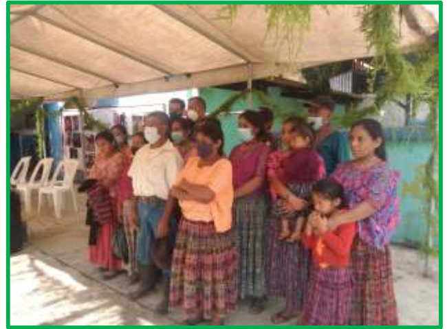
Un grupo bajó de Pansup para darnos la bienvenida

Pansup, situado a 2.350 metros de altitud, hace gala de unas temperaturas casi extremas. En la época seca (invierno), el frío se erige en protagonista. Y en la húmeda (verano), las lluvias casi torrenciales, además de adentrarse en las viviendas, generan una bruma casi continua. Aunque se nos invitó a visitar el caserío, declinamos la oferta. Sobre todo, al decirnos que un tramo considerable del recorrido había que hacerlo forzosamente a pie. La vejez impone, al respecto, unas normas bastante claras que la cordura invita a cumplir. Se nos