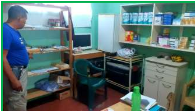
El despacho de Fratisa es también un dispensario

marzo. El contacto directo con aquellas etnias ha estimulado nuestro afán de mantener, y si fuera posible de intensificar, los diversos programas de ayuda.