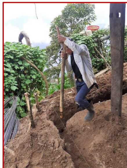
Excavando los cimientos con un tronco

A distancia no resulta fácil comprender cuándo y cómo puede torcerse un trámite de por sí intrascendente. Ya en el “proyecto Pancoj” tuvimos que afrontar una situación similar. Por más que se intentó entonces llegar a un acuerdo, resultó de todo punto