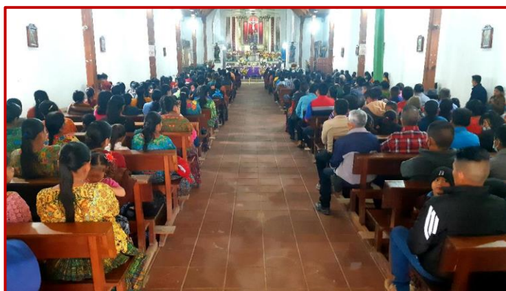
La afluencia de feligreses desborda el aforo de la iglesia