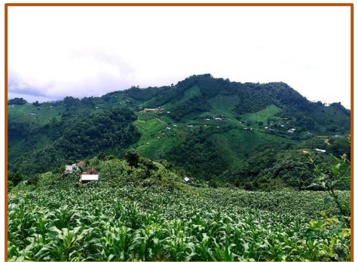
Caserío de Pansup: vista general

S egún cuenta la mitología griega, Zeus es el dios supremo del Olimpo. Mas, a su vez, como comedido peculiar, se compromete a regular las lluvias y las tormentas. Cuando está de buen humor, todo discurre en perfecta armonía. Por el contrario, sus enfados solo pueden presagiar huracanes, ciclones y aguaceros torrenciales. Pues bien, algo parecido ocurre –según las tradiciones mayas- con el dios Chaac, cuyos dos colmillos enrollados imponen, si no miedo, cuando menos profundo respeto. ¿Habrían hecho los pansupenses algo que pudiera airarlo? Aunque se ignore, lo cierto es que, en la primera quincena de julio, Chaac pareció estar bastante enojado. ¿Cómo explicar de otro modo los diluvianos chaparrones que de forma despiadada