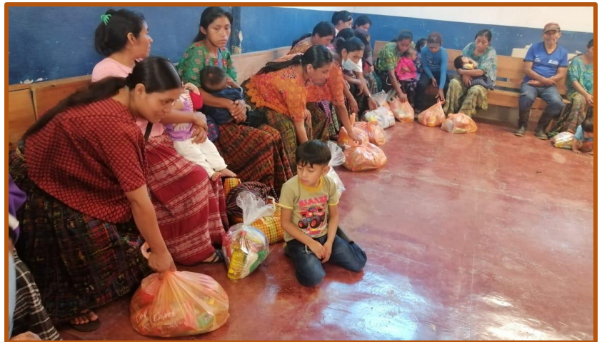
A punto de dar comienzo a la oración de agradecimiento

Como decía antes, la situación de nuestros aldeanos y campesinos cada vez se va tornando más trágica. Dado que en estos últimos tiempos estoy recorriendo bastantes caseríos, por fuerza he de escuchar los comentarios que afloran por doquier. Es sentir común que sus pocos campos de siembra están casi exhaustos. Ni tan siquiera las milpas ofrecen sus acostumbradas cosechas de maíz. Y sin este, no resulta posible la supervivencia. Todos conocen la causa, pero nadie puede aplicar el remedio. Se tiene, en efecto, muy claro que la esterilidad de los sembradíos se debe a que no reciben abonos. Estos resolverían un sinfín de problemas. Pero, ¿cómo comprarlos? Su absoluta falta de recursos les impide adquirir los fertilizantes indispensables para que los campos se recuperen. Y, mirando hacia el futuro, los augurios son muy poco halagüeños. Sin abonos, se acabarán agotando las cosechas.