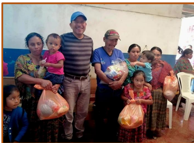
Compartiendo el júbilo de saberse queridos

Con motivo de la pandemia y últimamente a causa también de la invasión de Ucrania, los precios de los alimentos cada vez se están encareciendo más. La gente de muy escasos recursos se sabe incapaz de adquirir los insumos más indispensables. Incluso el maíz, que es la base de su sustento, ha experimentado una subida descomunal. Basta adentrarse en un mercado para escuchar los cuchicheos de las comadres, cuyo presupuesto no les alcanza hasta finalizar el mes. Siendo tan angustiada la situación, veo con tristeza que nuestras despensas cada vez tienen menos contenido. Tal es el motivo por el que me atrevo a sugerir la posibilidad de suprimir en el futuro las cestas de 75:00 quetzales, ya que, tras llenarlas, siguen estando casi vacías. Y se me parte el alma al constatar cómo las señoras de los caseríos