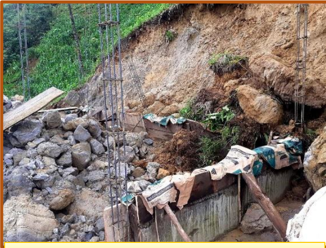
Los estragos del inoportuno derrumbe

¿Qué había ocurrido? Mientras unos hablaban de desgracia, otros apelaban a la ira del dios Chaac. Y es que este, cuando se indigna, juega muy malas pasadas. Aunque la primera reacción fuera de desespero, al serenarse los ánimos, tan inoportuno deslave fue entendido como advertencia divina para no truncar con esa casa el sacrosanto silencio del cerro. Siempre se ha dicho que vivir es interpretar. No dudo que los afectados, católicos a carta cabal, se aferrarían para ello a sus dogmas religiosos. Pero, ¿acaso ello impide que, entre los mayas de hoy, siga prodigándose el sincretismo? Y este, aunque se rija por los designios del auténtico Dios, nunca osaría desairar a las divinidades mayas. ¡Por si acaso! Mejor prudencia que lamento.