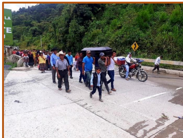
El cortejo fúnebre, en su último adiós a Fidel