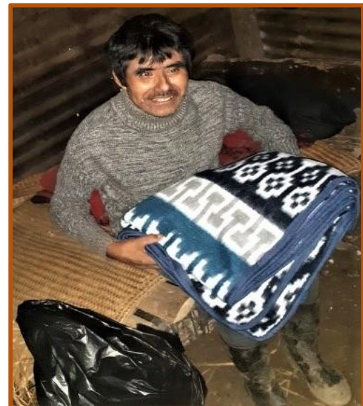
Cuando Fidel recibió un poncho como regalo

Conocido el complejo periplo de Francisco, me comprometí a ocuparme de él, no sin antes lanzar un buen rapapolvo a sus allegados por no haber acudido en su momento a un doctor. Ellos, bastante avergonzados, me confidenciaron que lo habían creído víctima de una hechicería, debida a una previa desavenencia con otro miembro de su comunidad. Y, ante tan singular protuberancia en su cráneo, desistieron de llevarlo a un hospital, por circular entre ellos la creencia de que allí solo se ingresa para morir. Víctimas de tan cretina ignorancia, cometieron -entre todos- la tropelía de encomendar su salud a quien casi lo condujo a la tumba.