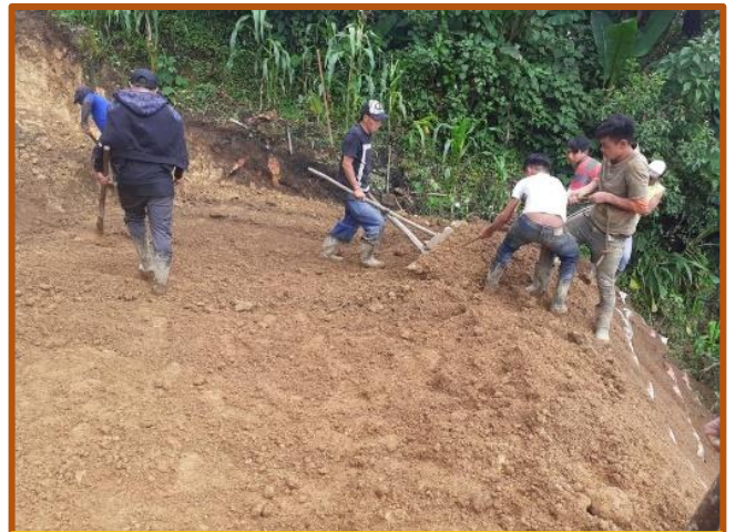
Allanando el solar para la nueva construcción

Es obvio que más de un lector se pregunte: ¿Por qué