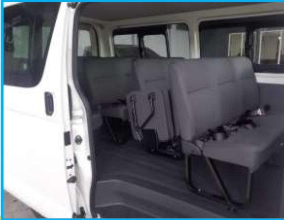
“Bucéfalo”, al servicio de los discapacitados

de forma. Obviamente, para entonces la espera ya se había prolongado un par de meses. Mas, aun así, hubo que reiniciar los trámites. Una vez ultimados, de nuevo se impuso esperar el sello definitivo que aprobara el nombramiento. La gestión, aunque se describa en un par de líneas, requirió bastantes meses.