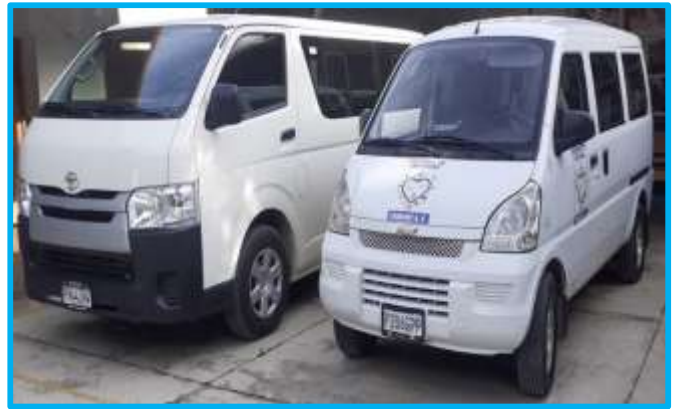
De “Rocinante” a “Bucéfalo”

su cometido, a pesar de haber nacido con ciertas taras mecánicas que con frecuencia la obligaban a recalar en la enfermería (taller). Por otra parte, su limitado aforo (8 plazas) no siempre le permitía soportar cargas cada vez más abultadas. ¿Cómo pretender que, a lomos de un simple rocín, se pensara en abrir nuevos horizontes? Su destaralado esqueleto rezongaba ante cualquier sobrepeso. Sus relinchos hacían recordar que él solo se había sentido a gusto al ser montado por el ínclito caballero manchego, tan sobrado de hidalguía como falto de sensatez. Rocinante pedía a gritos relevo. Se pensó, pues, en adquirir un nuevo trotón, no para avasallar reinos, sino para cubrir sin agobio el recorrido entre las aldeas y los nosocomios. Y así fue cómo, sin la menor renuencia, nuestro ya aviejado jamelgo cedió su primacía a Bucéfalo.