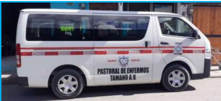
El nuevo microbús, dispuesto a cubrir la pastoral de enfermos

que servicial, furgoneta de 8 asientos. No es que dispongamos ahora de un Bucéfalo para conquistar imperios, pero cuando menos podremos cubrir con él las exigencias de una pastoral de enfermos, cada vez más afianzada. Si bien el momento de recibir este nuevo microbús ha sido de incontenible júbilo, ha ido precedido por una espera, si no angustiosa, cuando menos enervante. Se ha prolongado casi un año. Hasta parecía que los dioses mayas se confabulaban en contra nuestra.