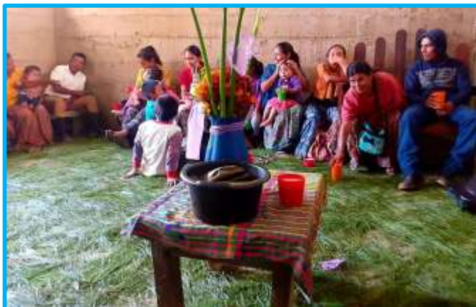
Celebrando la inauguración de la nueva casita

Su casita amenazaba ya ruina, pues algunas tablas estaban corroídas por el tiempo o carcomidas por la humedad. Llevaban años conviviendo con la inclemencia climática que –sobre todo en la época de lluvias– convertía