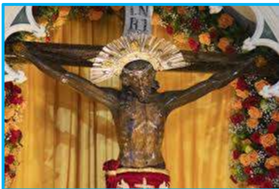
El Cristo Negro de Esquipulas