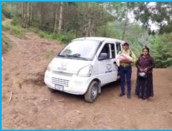
La forzosa jubilación de nuestra furgoneta