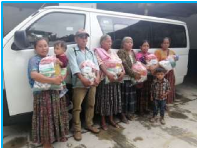
Una de las comunidades beneficiadas con la despensa

las familias de los siguientes caseríos: