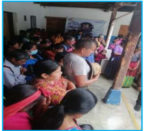
Nunca falta la oración de agradecimiento a Dios

De acuerdo con la praxis ya institucionalizada, voy determinando –en el transcurso del mes- a qué caseríos deberé convocar para la próxima ocasión. Y es que, en realidad, no todos reciben cada mes su anhelada bolsa. Al ser tanta la necesidad, me he visto obligado a convocarlos por turnos, ya que de lo contrario el día convenido se nos presentarían centenares de personas suscritas a la pobreza. Si bien la hambruna acosa a miles de indígenas dispersos por la serranía, solo incorporamos a nuestro proyecto a los de ínfimos recursos. Nuestros listados por fuerza han de ser cerrados. Y para inscribirlos en ellos, les exigimos copia de su DNI, que en cada ocasión han de presentarnos. Acordes con esta dinámica, para el mes de agosto, convocamos a