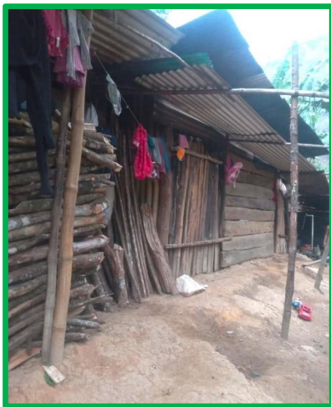
El antiguo hogar de la familia Xol Can