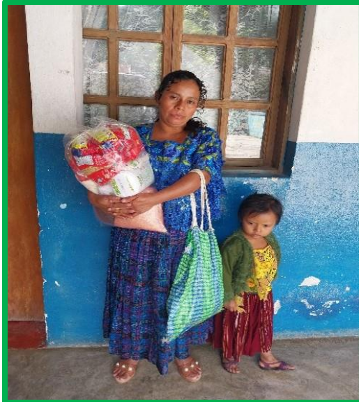
Una señora de Naxombal, tras recibir su cesta

S iempre será cierto que las costumbres acaban convirtiéndose en ley. Aun sin estar escrita, nadie la ignora. Así se vio esta vez en nuestro reparto de alimentos. Todos saben que Fratisa lo programa para el primer sábado de cada mes, que en junio coincidía con el día primero. Pues bien, en esa misma jornada yo tenía una cita médica en la capital, por lo que pospuse la entrega hasta el sábado siguiente (8 junio). Y eso provocó un poco de caos y un mucho de desconcierto. Fueron varios, en efecto, quienes -asiéndose a la costumbre- se personaron en las oficinas de Asumta, pensando que el día 1 iban a recibir su prebenda. Su inicial decepción quedó paliada al garantizarles que sería ofrecida el sábado siguiente. Acaso alguien se pregunte: ¿Por qué no se les avisó a tiempo del cambio? No era tan fácil hacerlo. La mayoría carece de móvil y quien lo tiene, no suele disponer de saldo. Y ello sin olvidar que muchos caseríos quedan fuera de cobertura. En todo caso, el amargor del día 1 quedaría educorado con el reparto del sábado siguiente.