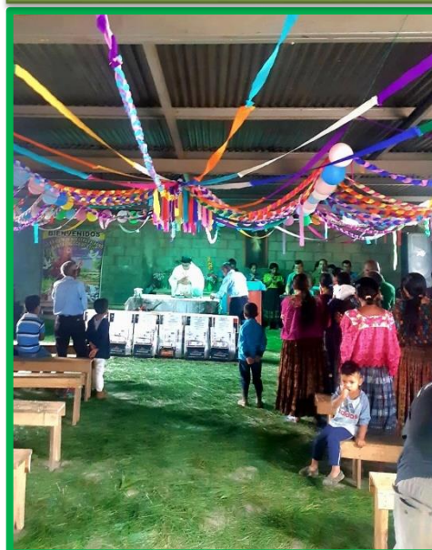
La solemne celebración eucarística