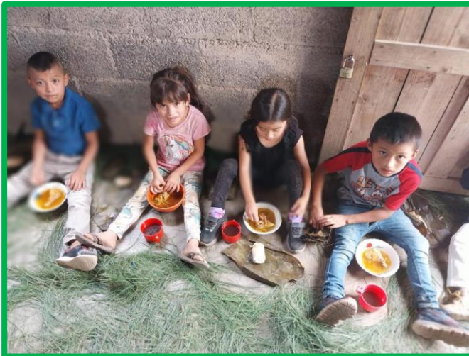
¿Alguien desea compartir nuestro caldo de pollo?

Finalizada la eucaristía, se celebró un antiguo rito maya en acción de gracias por el privilegio de vivir bajo un techo firme y seguro. Los mayas siempre han sido muy agradecidos con sus divinidades. Tal como dicta la costumbre, en casos así, sus plegarias y sus cantos se ensamblan con las velitas y los sahumerios. Era para ellos una celebración gozosa que, silenciando el desamparo, les permitía palpar el mimo divino. Tan entrañables momentos hacen que cada persona se inmerja en su propio mundo de ensueño donde no tienen acceso ni la frustración ni la angustia. La comunidad de San Francisco, aun blasonando de católica (¡lo es!), sigue aferrándose al rico acervo de su ancestral costumbrismo. Y ello le permite hacer gala de una muy peculiar idiosincrasia.