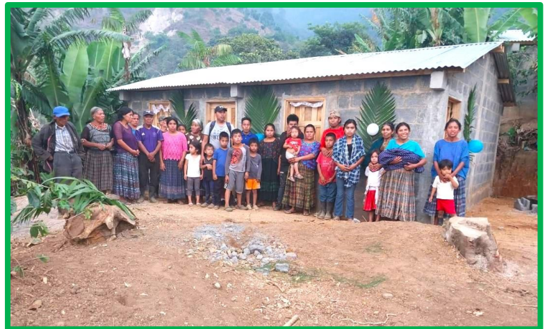
La comunidad de San Francisco, agradeciendo el proyecto

Para esas gentes resulta duro vivir en una sociedad donde se saben ignoradas. Cierto que, con frecuencia, algunos políticos las incentivan con promesas que -de no ser falaces- pondrían fin a su ostracismo. Pero los indígenas no ignoran que los vendedores de quimeras suelen buscar votos a cambio de bagatelas. Por eso, hartos de acumular desengaños, se resignan a convivir con su angustia. Viendo que a nadie le importan sus