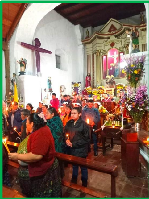
Fiesta patronal: celebración litúrgica

caseríos serranos, se adornan con sus mejores galas y bajan al poblado para compartir el regocijo comunitario. Se prodigan las actividades deportivas y culturales, así como los desfiles hípicas y los jaripeos donde lo más importante es participar. Llama la atención constatar que, si bien durante el año los tamahuneros apuestan por el recato, al celebrar sus fiestas patronales dan pábulo a la algazara. Todo el pueblo vibra en una misma frecuencia. No puedo omitir, al respecto, que mi buen amigo y colaborador, Giovani Pacay, es uno de los que más celo pone en dar realce a los eventos.