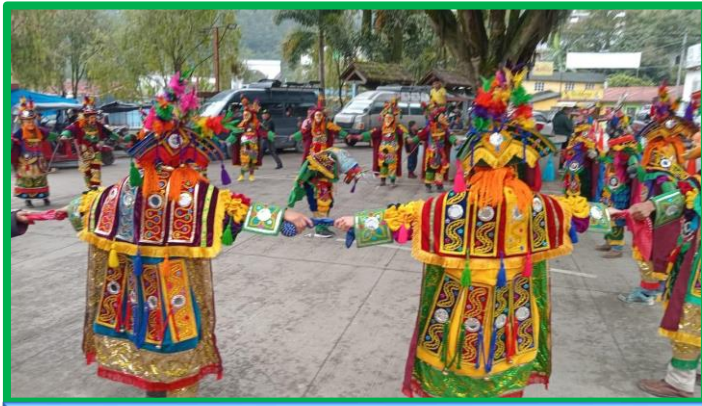
Ejecutando el "baile del venado"

Tras un par de horas de fallidos intentos, al fin se lanza un lazo al cuello del presunto animal que es arrastrado sin contemplaciones, celebrando con alborozo su captura. Como colofón, se sacrifica un venado de carne y hueso, cuyos despojos se convierten en el convite de los asistentes. Tal danza sirve de precuela a la solemne procesión, en la que los cofrades portan la imagen de su santo patrono, mientras el párroco -presidiéndola- agasaja a los asistentes con sus bendiciones. Es asimismo famosa la danza de los micos que en Tamahú -siempre fiel al costumbrismo maya- conserva un cariz muy especial. De acuerdo con la cosmogonía de los antiguos mayas, los primeros seres humanos se comportaban como si fueran monos que, trepando a los árboles, se lanzaban al vacío en su irresistible afán de corretear. A su vez, los micos se erigen en símbolo de unos mitológicos epónimos: Hunbatz y Hunchouen. Ambos, al saberse perseguidos por sus hermanos, treparon a la copa de los árboles, transformándose sin más en simios. De esta forma tan ingenua, se evoca el origen del hombre tal como lo consigna el Popol Vuh. Es una danza -muy valorada en la comarca- que cuenta siempre con el acompañamiento de la marimba y suele representarse ante la iglesia parroquial.