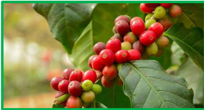
El vistoso fruto de los cafetos

la mengua. Ello explica que varios terratenientes, al ver mermadas sus ganancias, hayan dejado para mejor ocasión el cultivo de sus plantaciones. Y esto, obviamente, ha afectado muy de cerca a quienes, abocados al paro forzoso, se han quedado sin trabajo y, por ende, sin ingresos. Para afrontar su desventura, son bastantes las familias (niños incluidos) que se trasladan a Honduras durante un par de meses para conseguir algunos ingresos con la pisca del café.