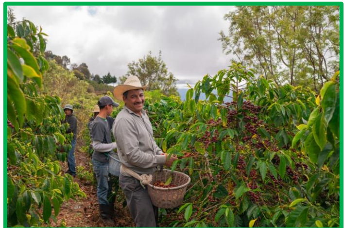
Recolectando café en Honduras