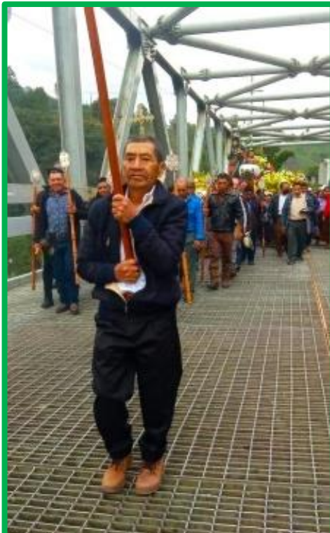
La procesión, con la imagen del santo patrono