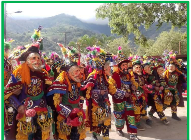
Preparados para el “baile del venado”

Aunque cada año se introduzcan eventos nuevos, siempre se mantiene el tradicional “baile del venado”. En torno a él se da cita casi todo el pueblo. Participa un grupo mínimo de diez personas, que se engalanan con trajes de colores muy vistosos, adornados con espejos, cascabeles y plumas, mientras cubren sus rostros con máscaras. Destaca quien, con un singular atuendo, representa al venado con su cornamenta. Todos comienzan a danzar en círculo, al compás de una marimba que interpreta el “Son del Venado”. Se baila en torno al ciervo, el cual, ante el acoso de los danzantes, trata de romper su cerco.