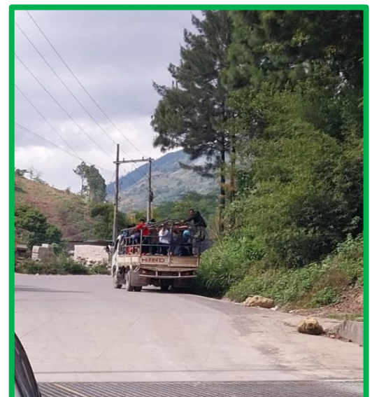
Un todoterreno recogiendo trabajadores

Todos los años, por esas fechas, en Tamahú no es difícil cruzarse con algún todoterreno que va recogiendo trabajadores para laborar en el país vecino durante la recolección del café. Cierto que en nuestro municipio abundan los cafetales. Pero, debido a los estragos causados por una plaga (roya), su productividad ha ido a